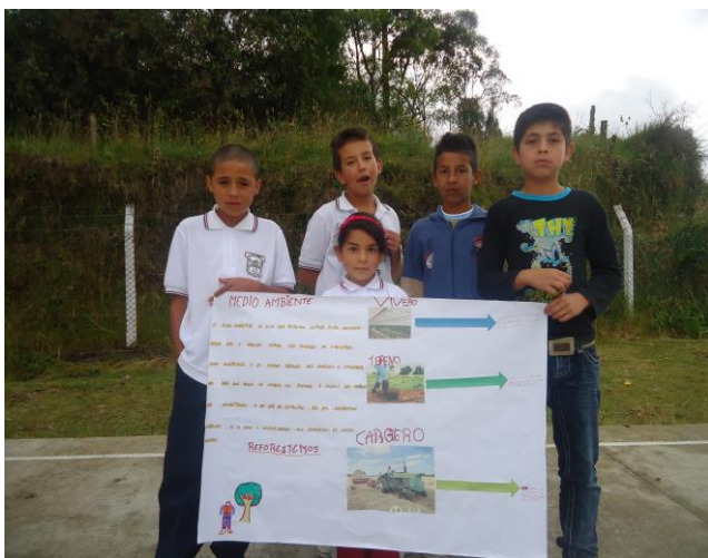
Taller de socialización en la escuela El Pindo - Villamaría

Se participa con la comunidad en actividades ambientales como celebración del día del agua y del medio ambiente, talleres sobre conservación de los recursos, y socializaciones con los vecinos y comunidades a cerca de la actividad que realiza la empresa.