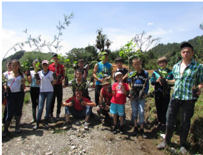
Enriquecimiento en el nacimiento de la microcuenca El Congal - Pensilvania