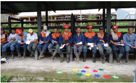
Capacitación con los colaboradores